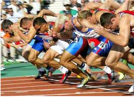
Nur der Wettkampf und der Vergleich mit den anderen Läufern zeigt wo jeder einzelne steht.