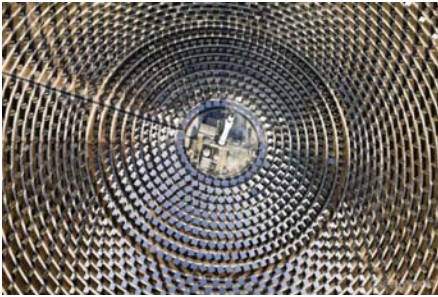
Solarenergie wird einen wichtiger Teil unserer Zukunft sein