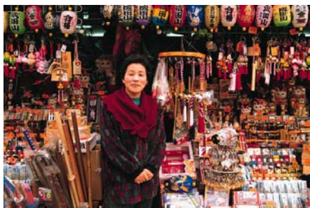
Das an die Kunden angepasste Sortiment, die Dienstleistungen und der Preis entscheiden über den Erfolg dieses Ladens in China.